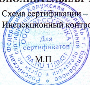
Схема сертификации – 1с(м). Инспекционный контроль – октябрь 2024 года, октябрь 2025 года.